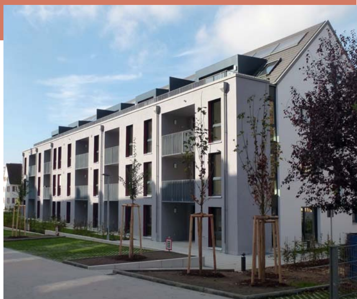
Seit 1960 hat sich die Wohnfläche pro Person in Deutschland mehr als verdoppelt.

Der Zweite Weltkrieg zerstörte viel Wohnraum in Deutschland. Doch auch dank der regen Bautätigkeit der Genossenschaften war die Wohnungsnot innerhalb weniger Jahre besiegt. Mit dem Wohlstand stiegen die Ansprüche an den Wohnraum. Heute wohnen die meisten Deutschen so komfortabel wie nie: im Durchschnitt auf 46 Quadratmetern pro Person. Damit hat sich die durchschnittliche Wohnfläche pro Person seit 1960 mehr als verdoppelt – und sie steigt weiter. Übrigens auch im internationalen Vergleich: In China wohnt eine Person durchschnittlich auf 30 Quadratmetern, in Russland auf 22, in der Türkei auf 18. Mehr Platz haben allerdings die US-Amerikaner mit durchschnittlich rund 75 Quadratmetern Wohnfläche pro Person.