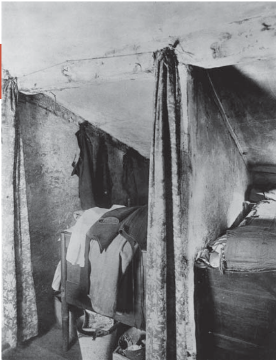
Betten wurden im Schichtbetrieb genutzt.