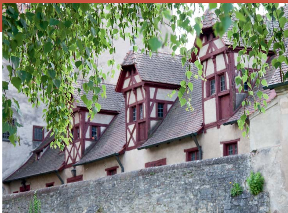
Arbeiten im Erdgeschoss – wohnen darüber: typisches städtisches Leben seit dem Mittelalter.

Ein Haus nur zum Wohnen? Im Mittelalter war den meisten Menschen dieses Konzept fremd. Man wohnte weiter in Langhäusern, die sich zu etwas stabileren und komfortableren Hallenhäusern weiterentwickelten. Langsam etablierten sich abgetrennte Räume für einzelne Bewohner. Unter diesen waren auf dem Lande meist auch Tiere – Menschen und Vieh schliefen Tür an Tür. Auch in den Städten kombinierte man Wohnen und Arbeiten. Heute würden Makler davon sprechen, dass eine „Home-Office-Maisonette-Lösung“ möglich sei. Früher hieß das praktisch: Der Schmied hat seine Werkstatt im Erdgeschoss seines schmalen Fachwerkhäuses – und seine Wohnung darüber.